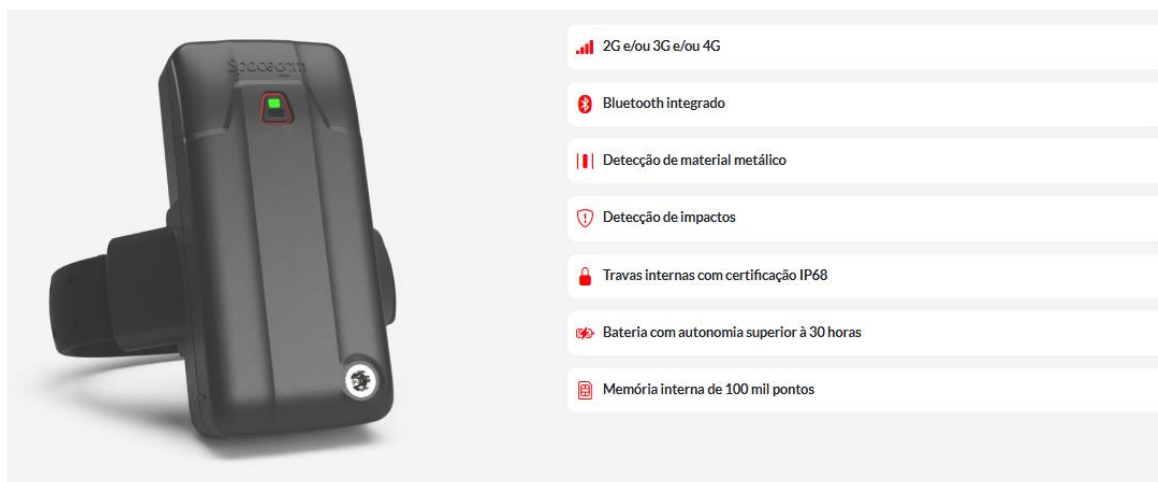
FIGURA 2 - Características do dispositivo eletrônico