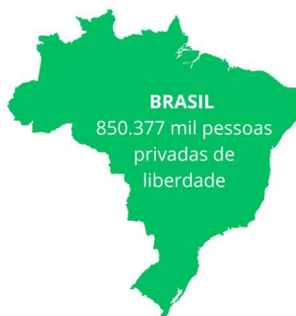
FIGURA 1 - Mapa ilustrativo do Brasil com o número de pessoas privadas de liberdade no Sistema Penitenciário em 2023

No Brasil, dados do Ministério dos Direitos Humanos e da Cidadania - MDHC, por meio da plataforma Observatório Nacional dos Direitos Humanos - ObservaDH (Brasil, 2025) divulgou que em 2023 a população privada de liberdade no sistema penitenciário brasileiro possui mais 850 mil pessoas, incluindo pessoas em celas físicas e em prisão domiciliar, caracterizando o país com a terceira maior população carcerária do mundo.